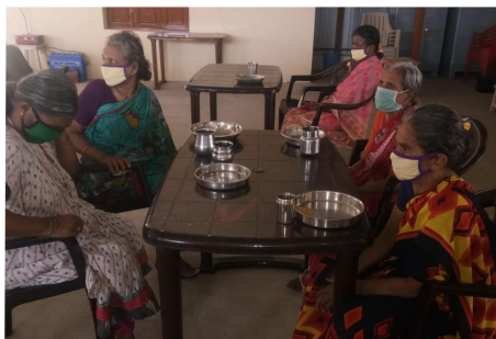
Repas dans la salle commune du Old Age Home

être soutenu par le gouvernement. Bonne nouvelle, le mur entourant le bâtiment a été crépi ; il n'y aura plus que la peinture à appliquer lorsque le confinement sera levé. Une fois le mur peint, il sera possible de demander une nouvelle inspection du gouvernement pour obtenir leur soutien, et d'offrir par conséquent une forme de pérennité au Old Age Home par leur soutien financier. De plus, la construction de la salle commune supplémentaire, servant également de réfectoire, a été achevée rapidement. Elle a été inaugurée le 28 avril dernier.