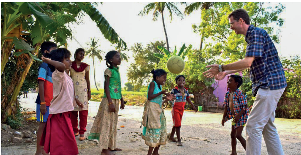
Les activités sportives reprendront de plus belle avec le nouveau toit