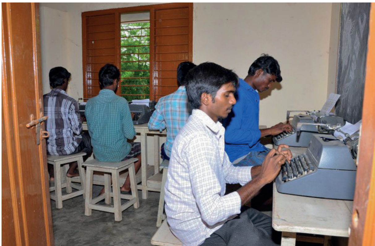
Nous vogueons avec le temps, le projet ordinateur vient remplacer celui de dactylographie

En raison de la situation économique actuelle, nous avons décidé de ne facturer aucun frais d'écolage les trois premières années. Grâce au financement de la Fondation Sandoz et de l'Association de l'Arc, nous pouvons assurer le salaire de l'enseignant ainsi que la plus grande partie du matériel. Nous recherchons encore la somme de Frs. 1'000.- pour financer l'ensemble du projet.