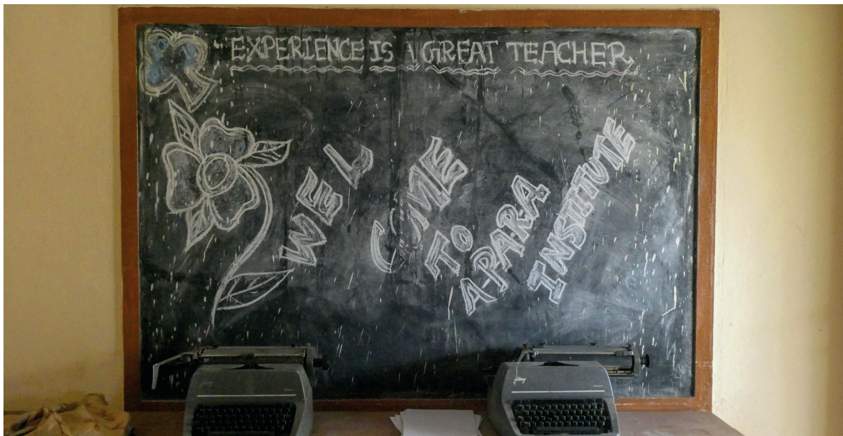
APARA et l'éducation, une histoire d'expérience...

Bienvenue à elles et bonne lecture à vous!