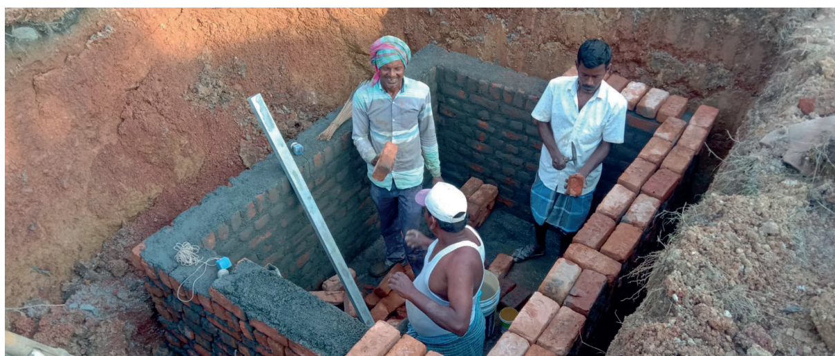
Les fondations pour les nouvelles toilettes du Old Age Home